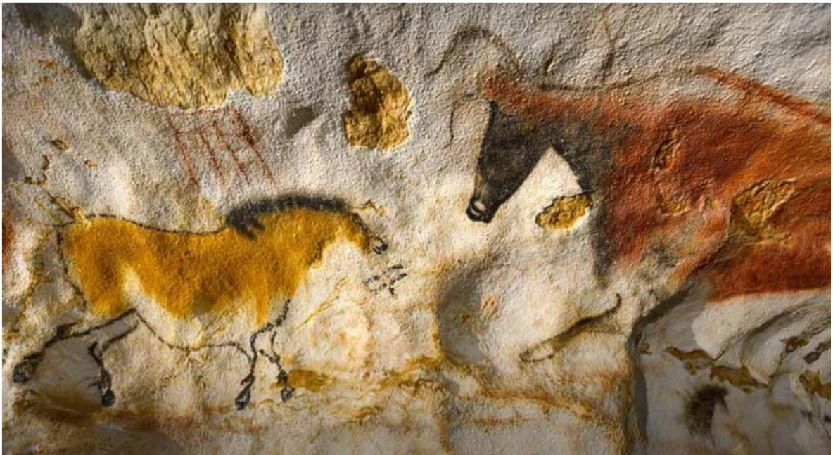
Cueva de Lascaux (Francia)